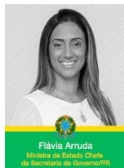
Flávia Arruda Ministra de Estado Chefe da Secretaria de Governo/PR