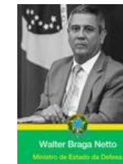
Walter Braga Netto Ministro de Estado da Defesa

Nilson Leitão Ex-deputado federal (PSDB/MT)