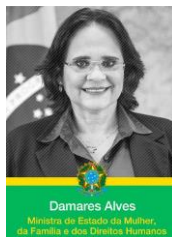
Damares Alves Ministra de Estado da Mulher, da Família e dos Direitos Humanos

Data limite: 2 de abril - seis meses antes das eleições