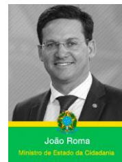
João Roma Ministro de Estado da Cidadania