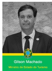
Gilson Machado Ministro de Estado do Turismo