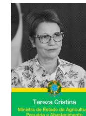
Tereza Cristina Ministra de Estado da Agricultura, Pecuária e Abastecimento