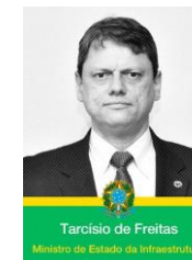
Tarcísio de Freitas Ministro de Estado da Infraestrutura

Pedro Guimarães Presidente Caixa Econômica Federal