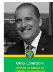
Onyx Lorenzoni Ministro de Estado do Trabalho e Previdência

Marcelo Magalhães Secretário Especial do Esporte do Ministério da Cidadania